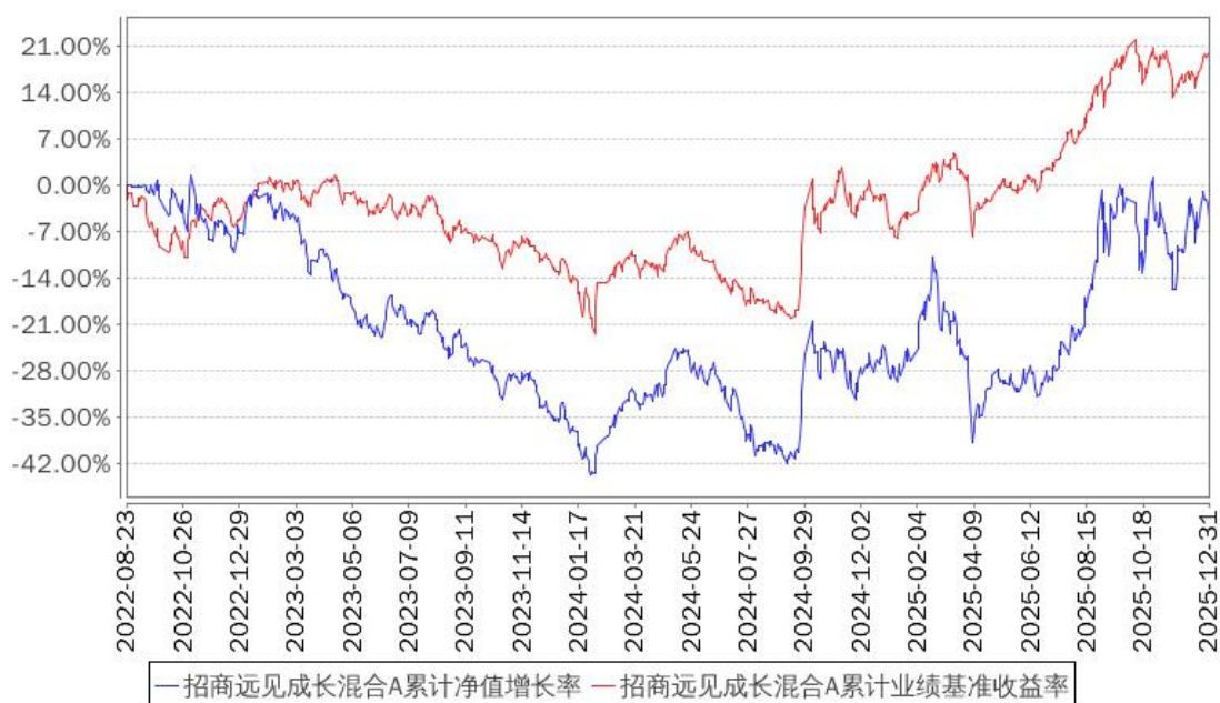
招商远见成长混合A累计净值增长率与同期业绩比较基准收益率的历史走势对比图