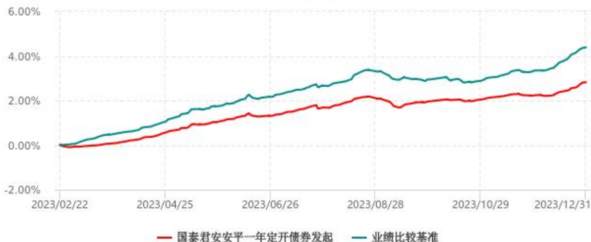
国泰君安安平一年定期开放债券型发起式证券投资基金累计净值增长率与业绩比较基准收益率历史走势对比图 (2023年02月22日-2023年12月31日)

注：1、本基金于 2023 年 02 月 22 日成立，自合同生效日起至本报告期末不足一年。