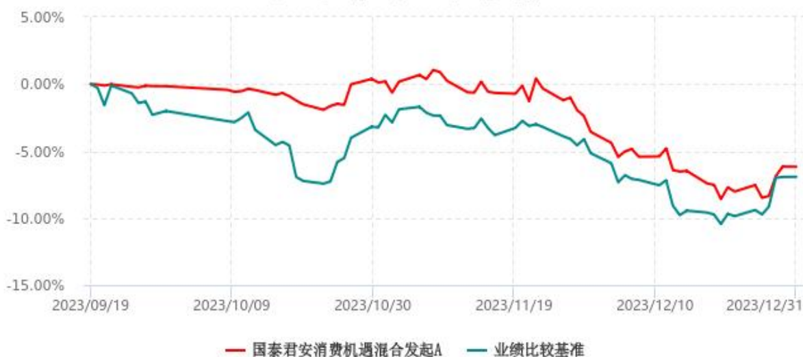
国泰君安消费机遇混合发起A累计净值增长率与业绩比较基准收益率历史走势对比图 (2023年09月19日-2023年12月31日)

注：本基金于 2023 年 9 月 19 日成立，自合同生效日起至本报告期末不足一年。