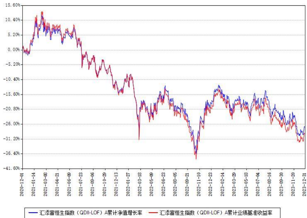
汇添富恒生指数（QDII-LOF）A累计净值增长率与同期业绩基准收益率对比图