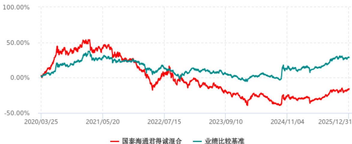
国泰海通君得诚混合型证券投资基金累计净值增长率与业绩比较基准收益率历史走势对比图 (2020年03月25日-2025年12月31日)