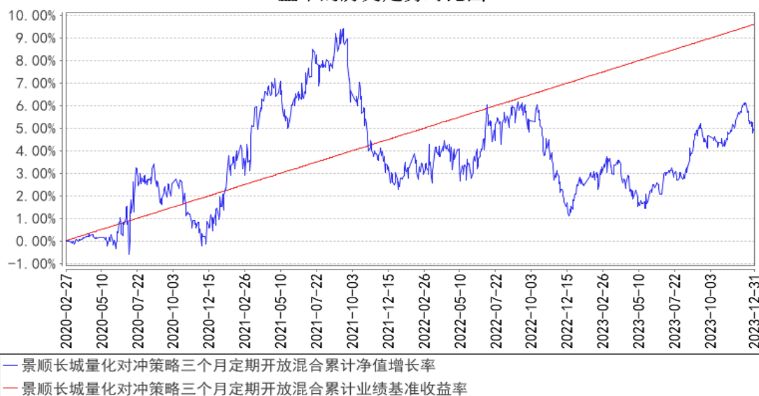
景顺长城量化对冲策略三个月定期开放混合累计净值增长率与同期业绩比较基准收益率的历史走势对比图