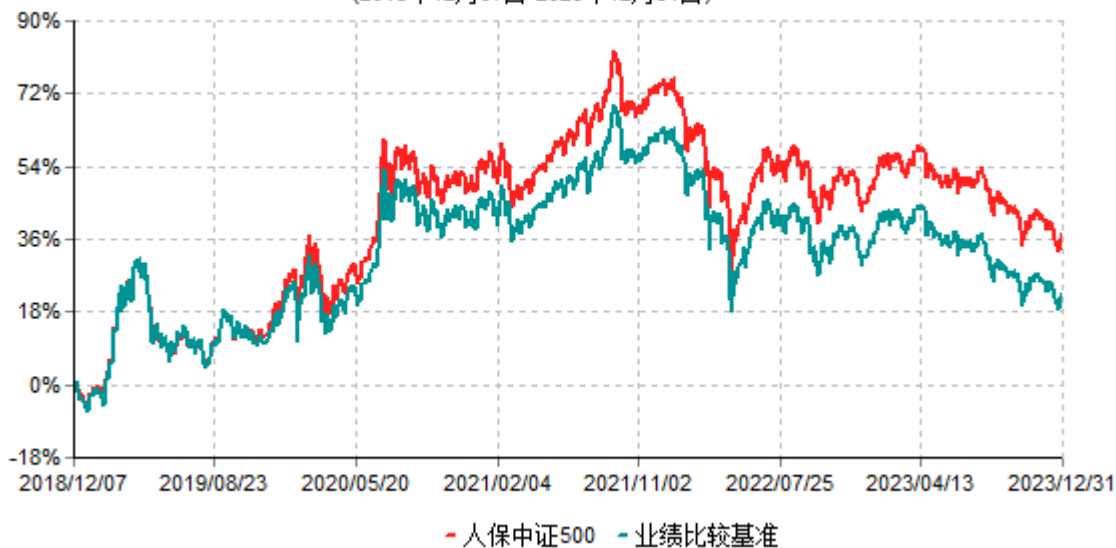
人保中证500指数型证券投资基金累计净值增长率与业绩比较基准收益率历史走势对比图 (2018年12月07日-2023年12月31日)

注：1、本基金基金合同于2018年12月7日生效。根据基金合同规定，本基金建仓期为6个月，建仓期结束，本基金的各项投资比例符合基金合同的有关约定。