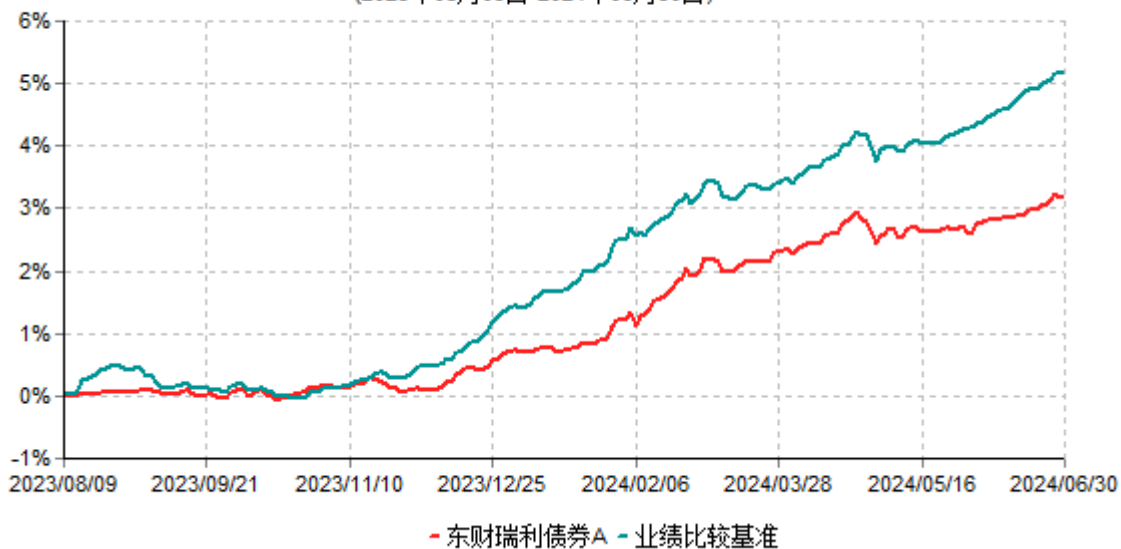
东财瑞利债券A累计净值增长率与业绩比较基准收益率历史走势对比图 (2023年08月09日-2024年06月30日)