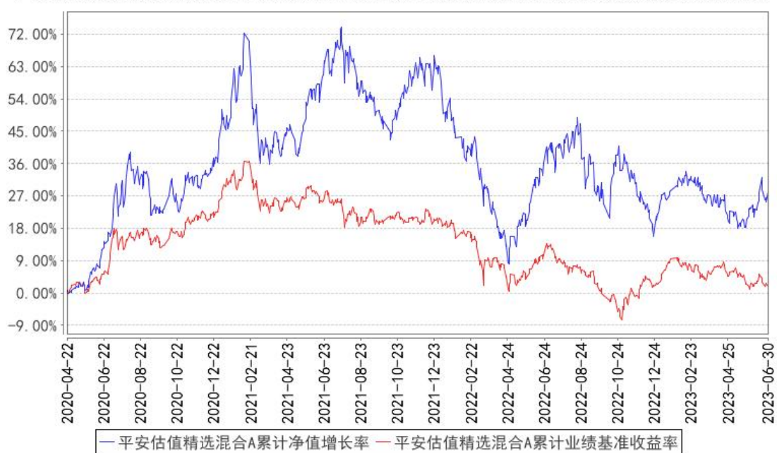
平安估值精选混合A累计净值增长率与同期业绩比较基准收益率的历史走势对比图