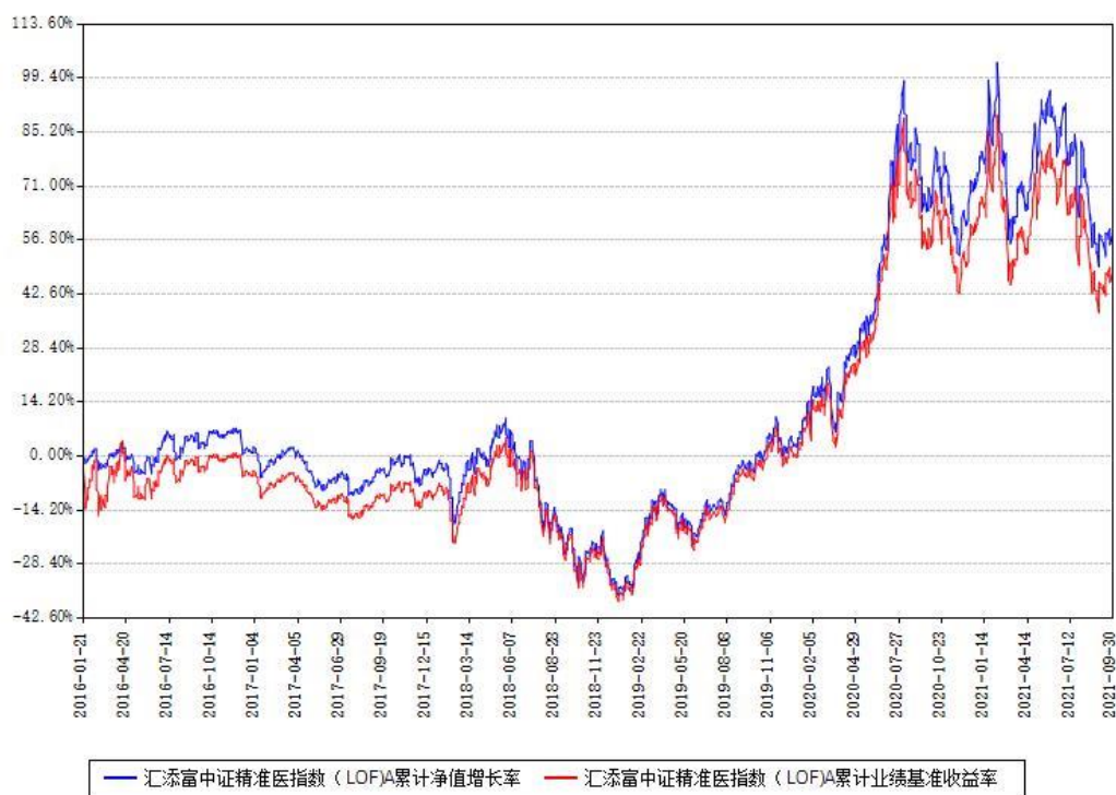
汇添富中证精准医指数（LOF）A累计净值增长率与同期业绩比较基准收益率对比图