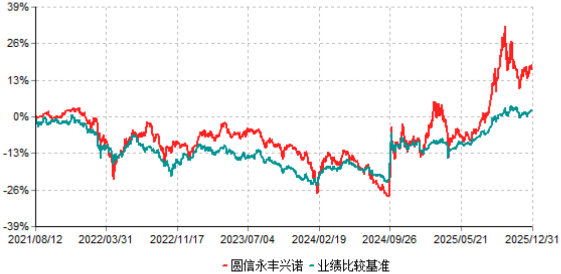
圆信永丰兴诺累计净值增长率与业绩比较基准收益率历史走势对比图 (2021年08月12日-2025年12月31日)