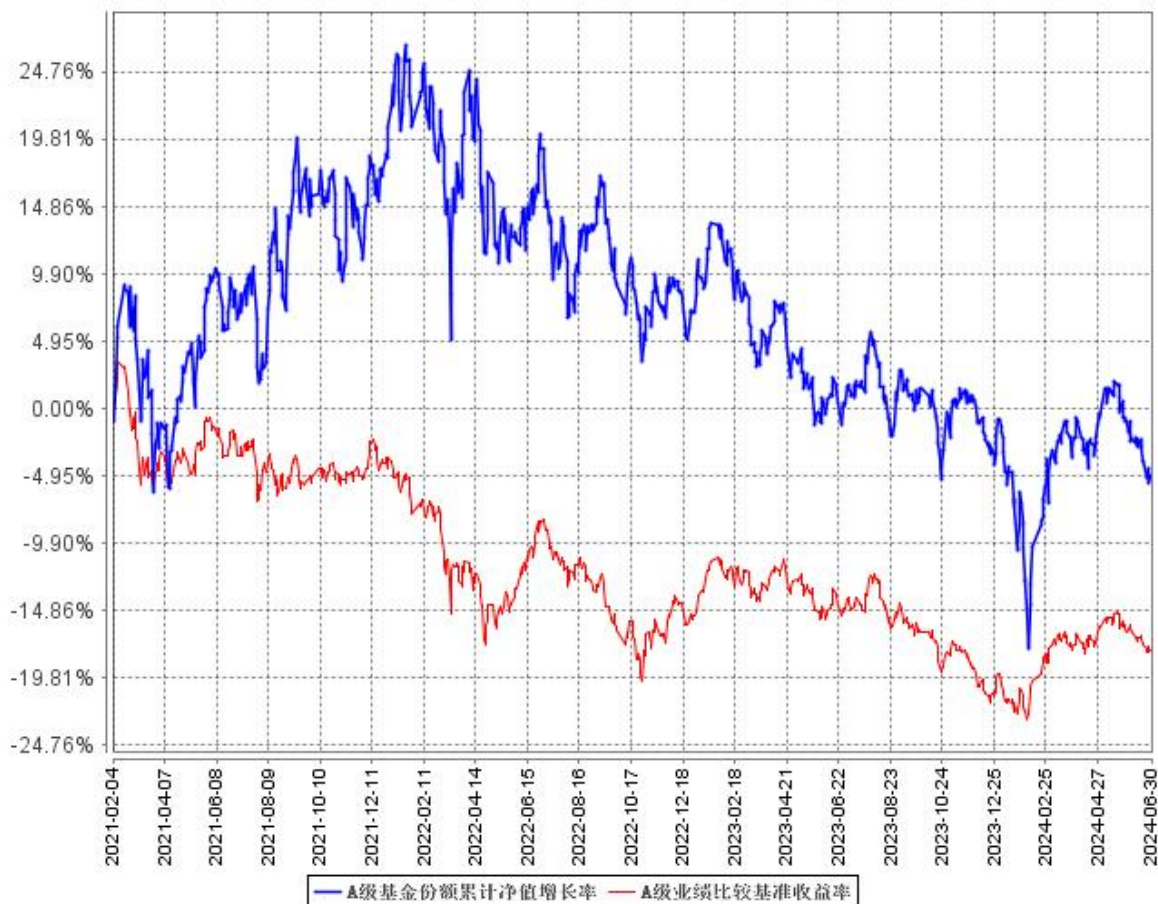
A 级基金份额累计净值增长率与同期业绩比较基准收益率的历史走势对比图