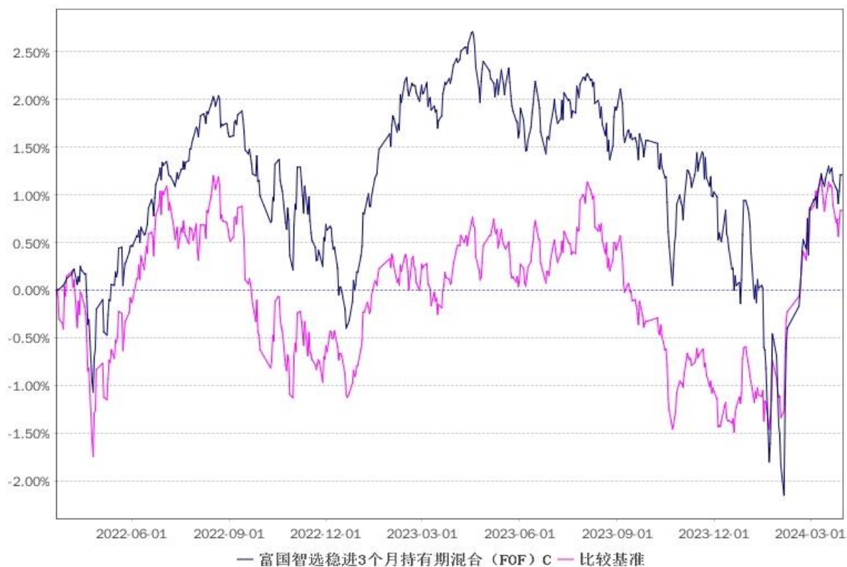
净值增长率与业绩比较基准收益率的历史走势对比图