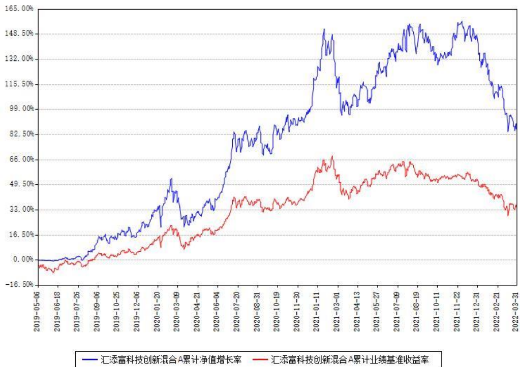
汇添富科技创新混合A累计净值增长率与同期业绩基准收益率对比图