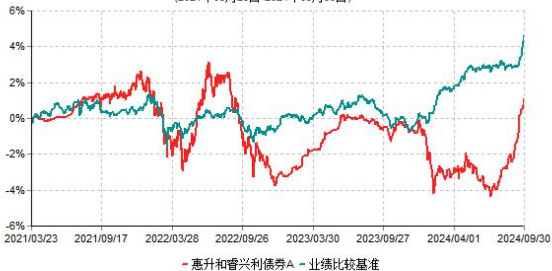
惠升和睿兴利债券A累计净值增长率与业绩比较基准收益率历史走势对比图 (2021年03月23日-2024年09月30日)