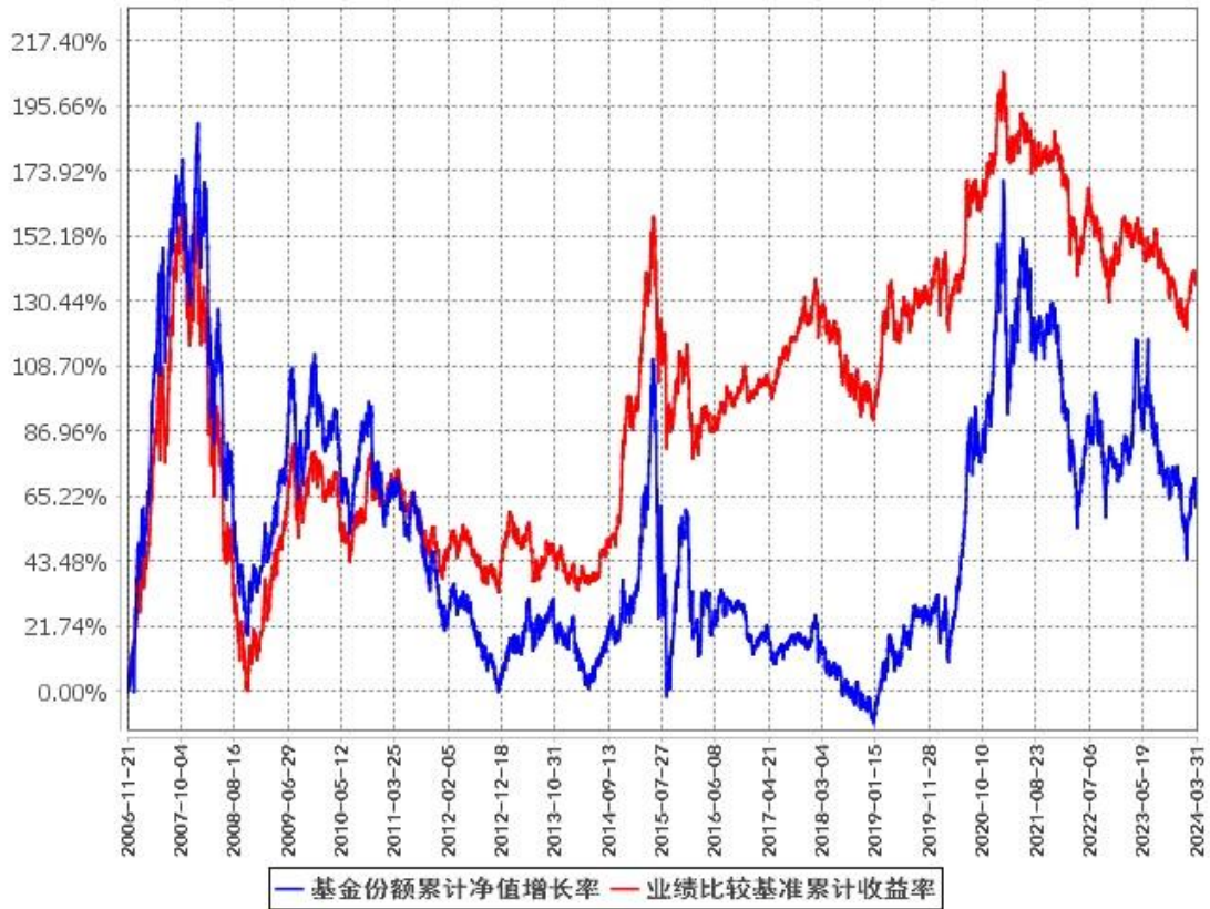
基金份额累计净值增长率与同期业绩比较基准收益率的历史走势对比图 (2006年11月21日至2024年3月31日)

注：1、根据本基金的基金合同第十一部分“基金投资”中“八、投资组合限制”的规定，本基金自 2006 年 11 月 21 日合同生效之日起六个月内为建仓期，建仓期结束时各项资产配置比例符合基金合同约定。