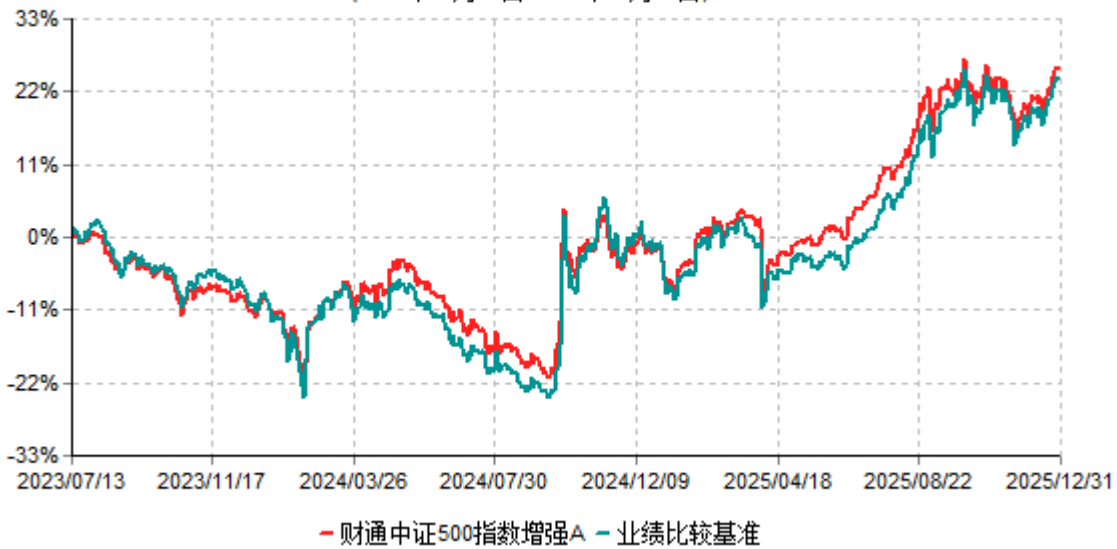
财通中证500指数增强A累计净值增长率与业绩比较基准收益率历史走势对比图 (2023年07月13日-2025年12月31日)