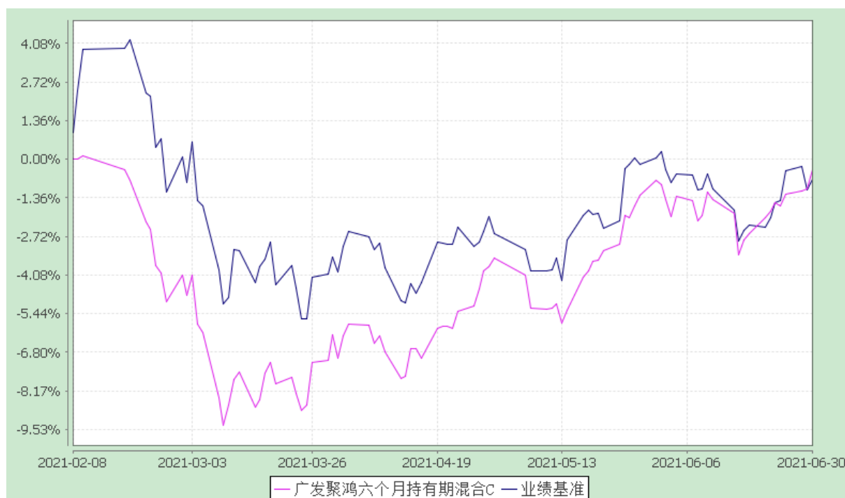
广发聚鸿六个月持有期混合 E