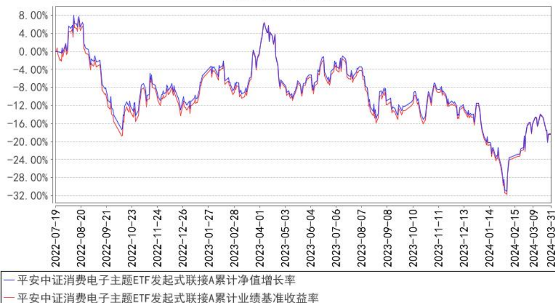
平安中证消费电子主题ETF发起式联接A累计净值增长率与同期业绩比较基准收益率的历史走势对比图