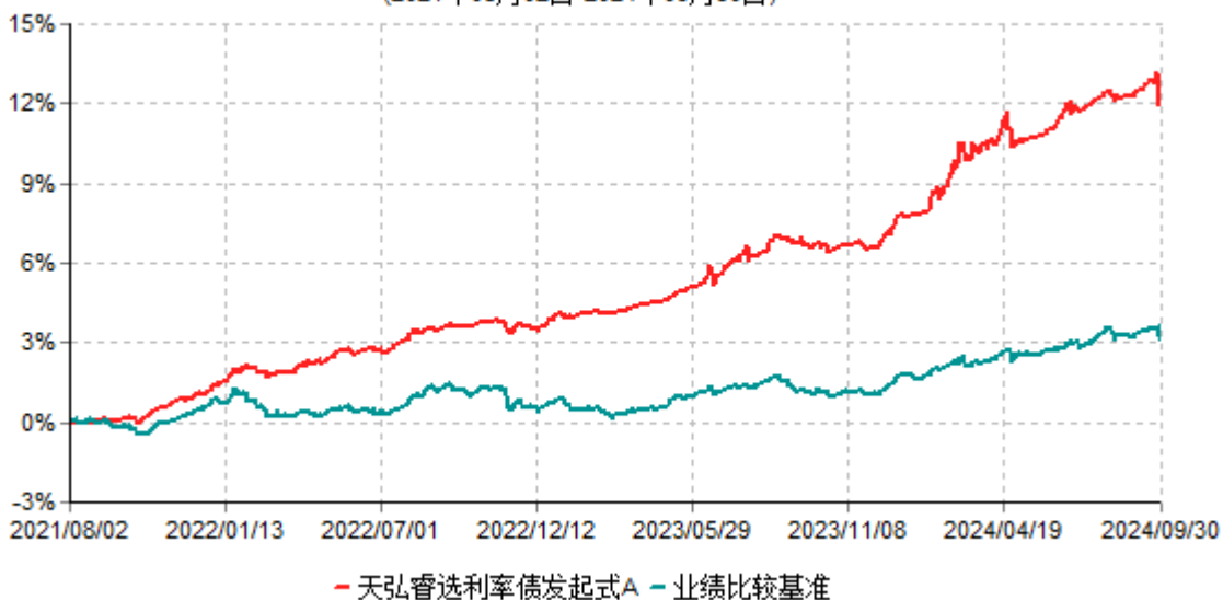
天弘睿选利率债发起式A累计净值增长率与业绩比较基准收益率历史走势对比图 (2021年08月02日-2024年09月30日)