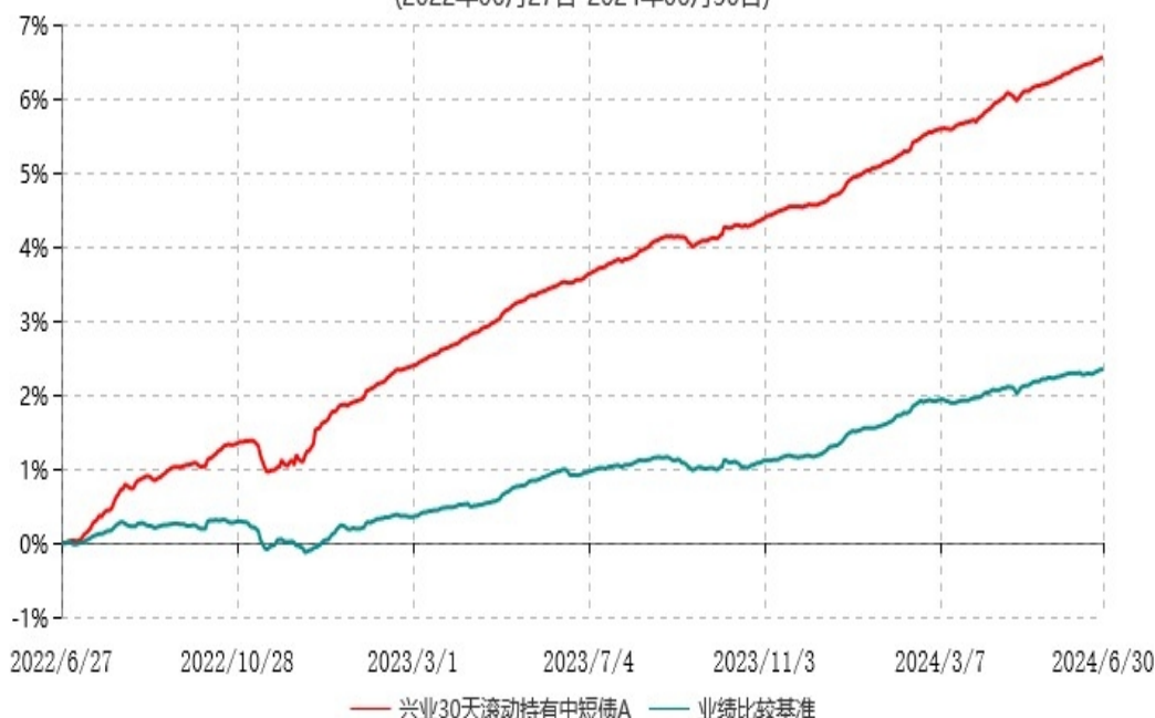
兴业30天滚动持有中短债A累计净值增长率与业绩比较基准收益率历史走势对比图 (2022年06月27日-2024年06月30日)