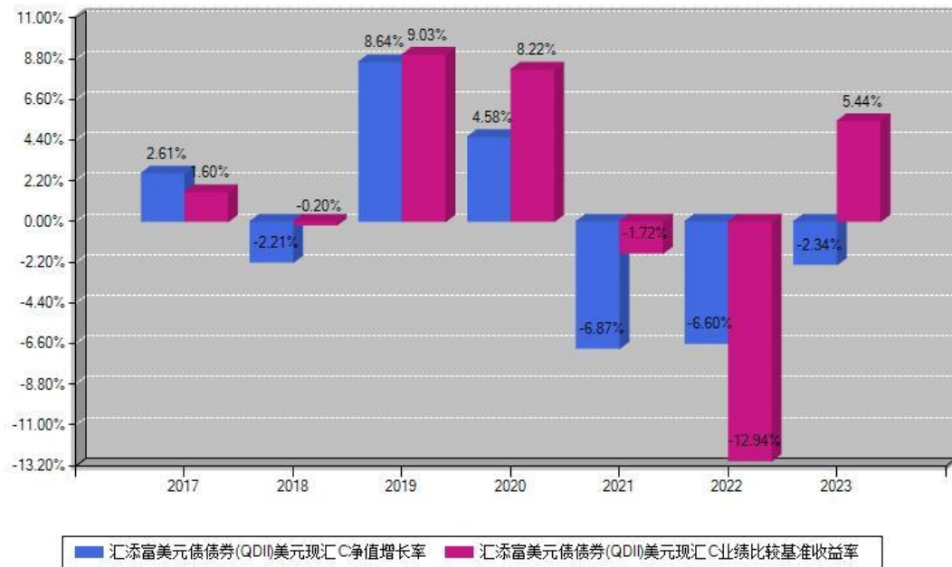
汇添富美元债债券(QDII)美元现汇C每年净值增长率与同期业绩基准收益率对比图

注：数据截止日期为2023年12月31日，基金的过往业绩不代表未来表现。本《基金合同》生效之日为2017年04月20日，合同生效当年按实际存续期计算，不按整个自然年度进行折算。