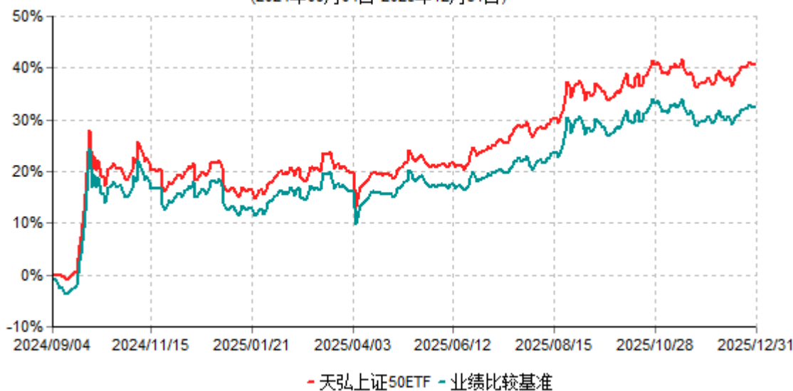
天弘上证50ETF累计净值增长率与业绩比较基准收益率历史走势对比图 (2024年09月04日-2025年12月31日)