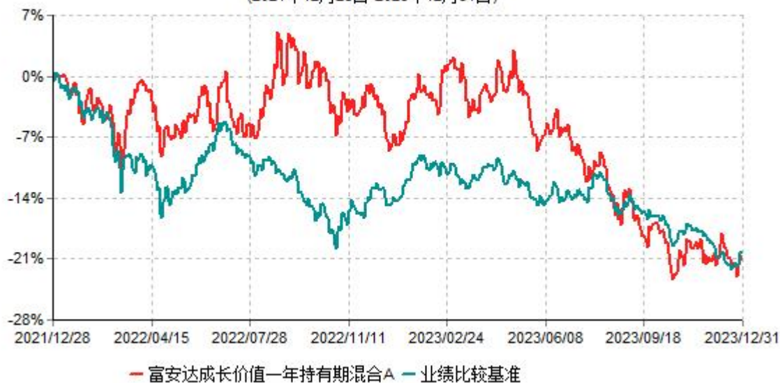
富安达成长价值一年持有期混合A累计净值增长率与业绩比较基准收益率历史走势对比图 (2021年12月28日-2023年12月31日)