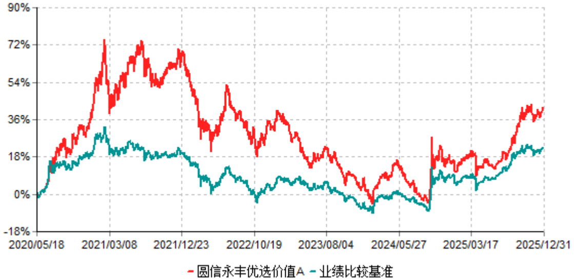
圆信永丰优选价值A累计净值增长率与业绩比较基准收益率历史走势对比图 (2020年05月18日-2025年12月31日)