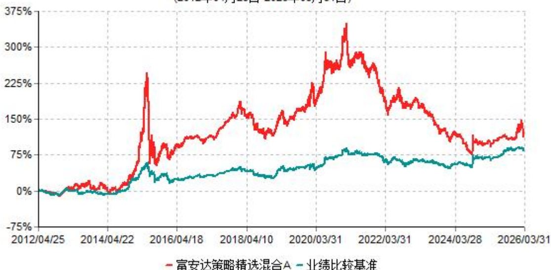
富安达策略精选混合A累计净值增长率与业绩比较基准收益率历史走势对比图 (2012年04月25日-2026年03月31日)