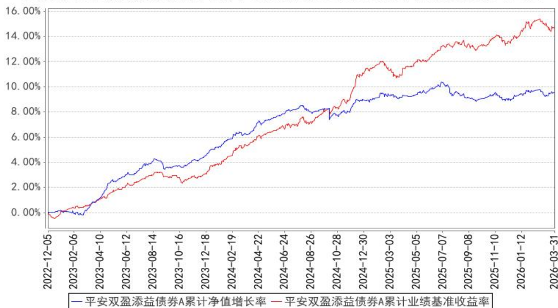
平安双盈添益债券A累计净值增长率与同期业绩比较基准收益率的历史走势对比图