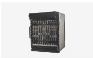
接入汇聚与集群软交换设备