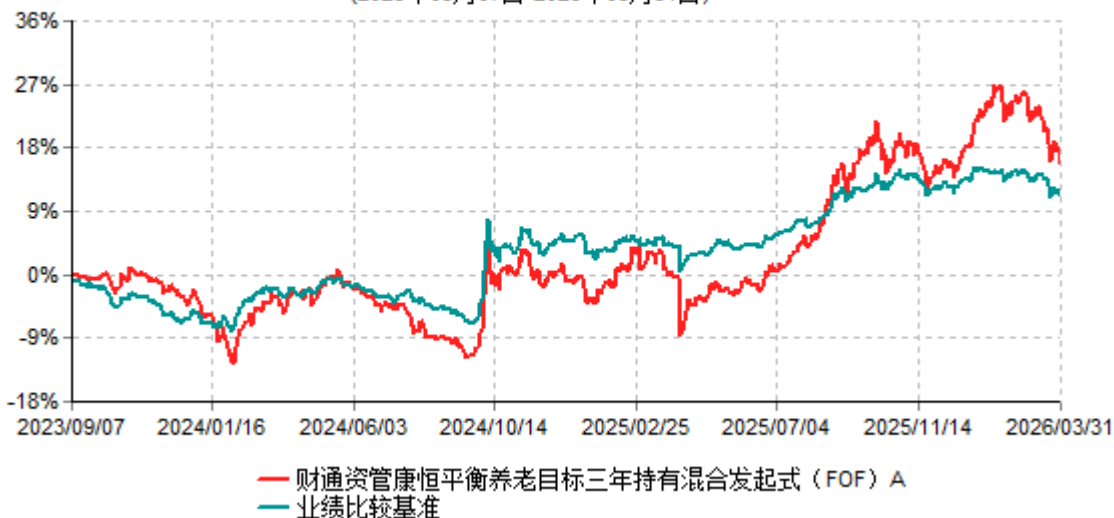
财通资管康恒平衡养老目标三年持有混合发起式（FOF）A累计净值增长率与业绩比较基准收益率历史走势对比图 (2023年09月07日-2026年03月31日)