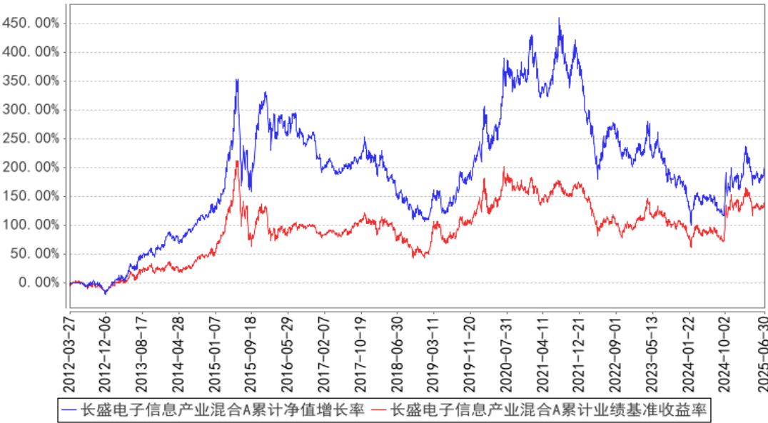
长盛电子信息产业混合A累计净值增长率与同期业绩比较基准收益率的历史走势对比图