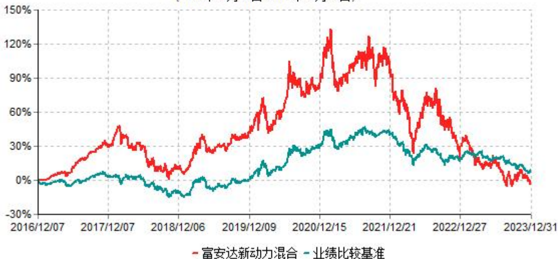
富安达新动力灵活配置混合型证券投资基金累计净值增长率与业绩比较基准收益率历史走势 对比图 (2016年12月07日-2023年12月31日)