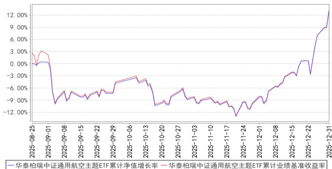
华泰柏瑞中证通用航空主题ETF累计净值增长率与同期业绩比较基准收益率的历史走势对比图

注：1、图示日期为2025年8月25日（基金合同生效日）至2025年12月31日。