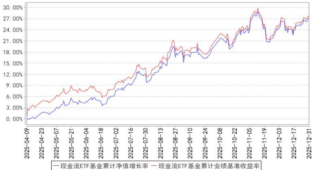
现金流ETF基金累计净值增长率与同期业绩比较基准收益率的历史走势对比图

注：本基金合同生效日期为2025年04月09日，自基金合同生效日起到本报告期末不满一年，按基金合同的规定，本基金自基金合同生效起六个月为建仓期，建仓期结束时本基金的各项投资比例已达到基金合同的规定：在建仓完成后，本基金投资于标的指数成份股及备选成份股的资产不低于基金资产净值的90%，且不低于非现金基金资产的80%，每个交易日日终在扣除股指期货合约、股票期权合约和国债期货合约需缴纳的交易保证金后，应当保持不低于交易保证金一倍的现金，其中，现金不包括结算备付金、存出保证金和应收申购款等，因法律法规的规定而受限制的情形