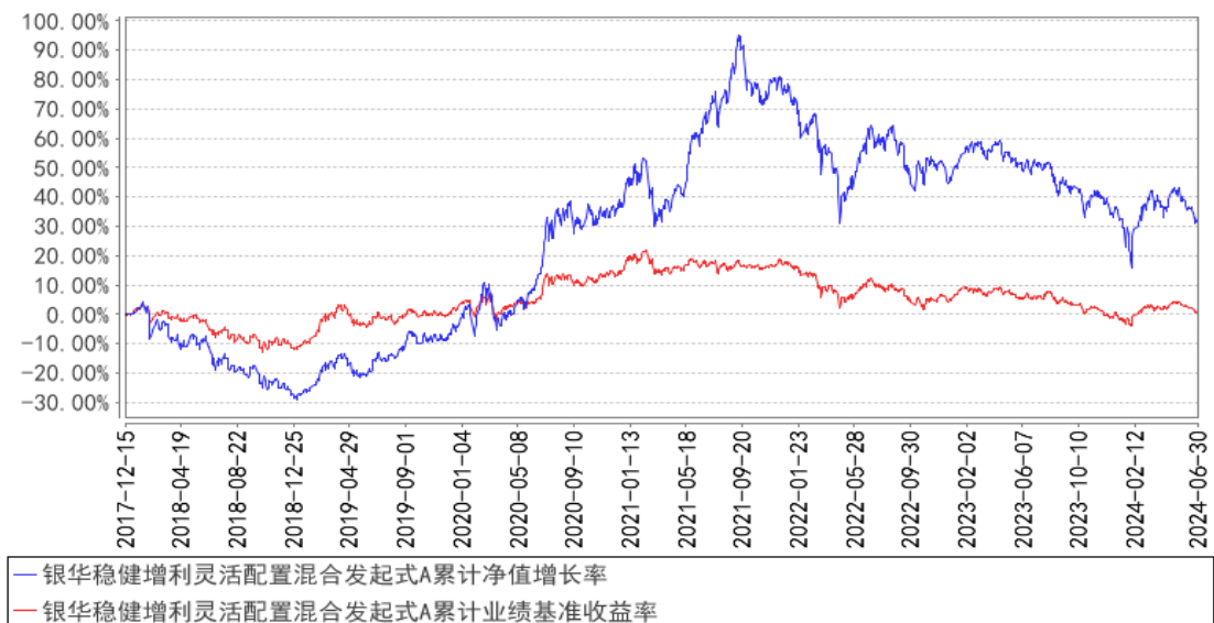
银华稳健增利灵活配置混合发起式A累计净值增长率与同期业绩比较基准收益率的历史走势对比图