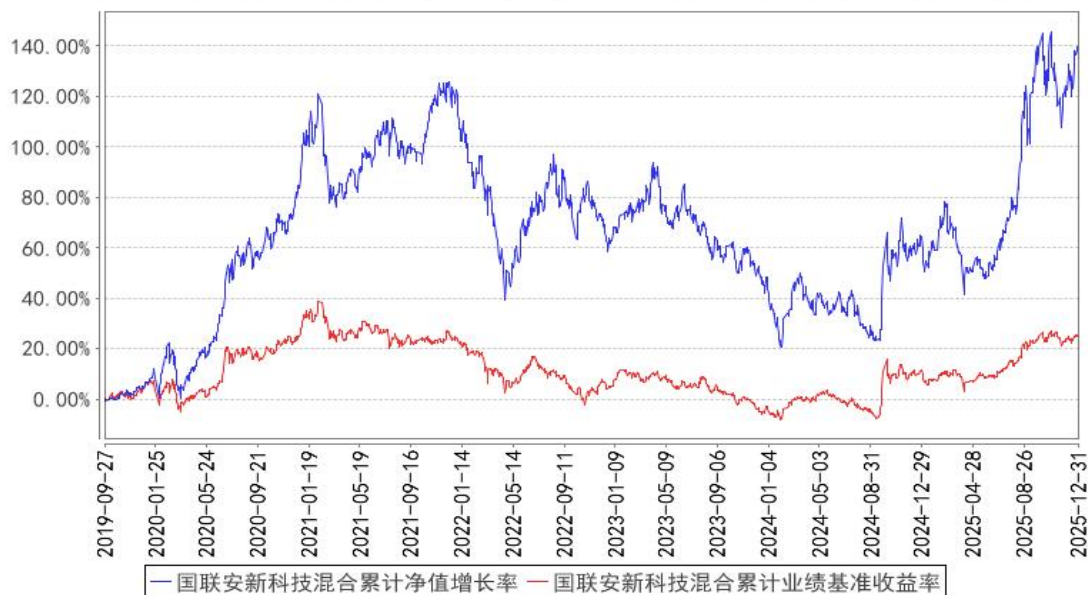
国联安新科技混合累计净值增长率与同期业绩比较基准收益率的历史走势对比图

注：1、本基金业绩比较基准为沪深 300 指数收益率*75%+上证国债指数收益率*25%； 2、本基金基金合同于 2019 年 9 月 27 日生效； 3、本基金建仓期为自基金合同生效之日起的 6 个月，建仓期结束时各项资产配置符合合同约定。