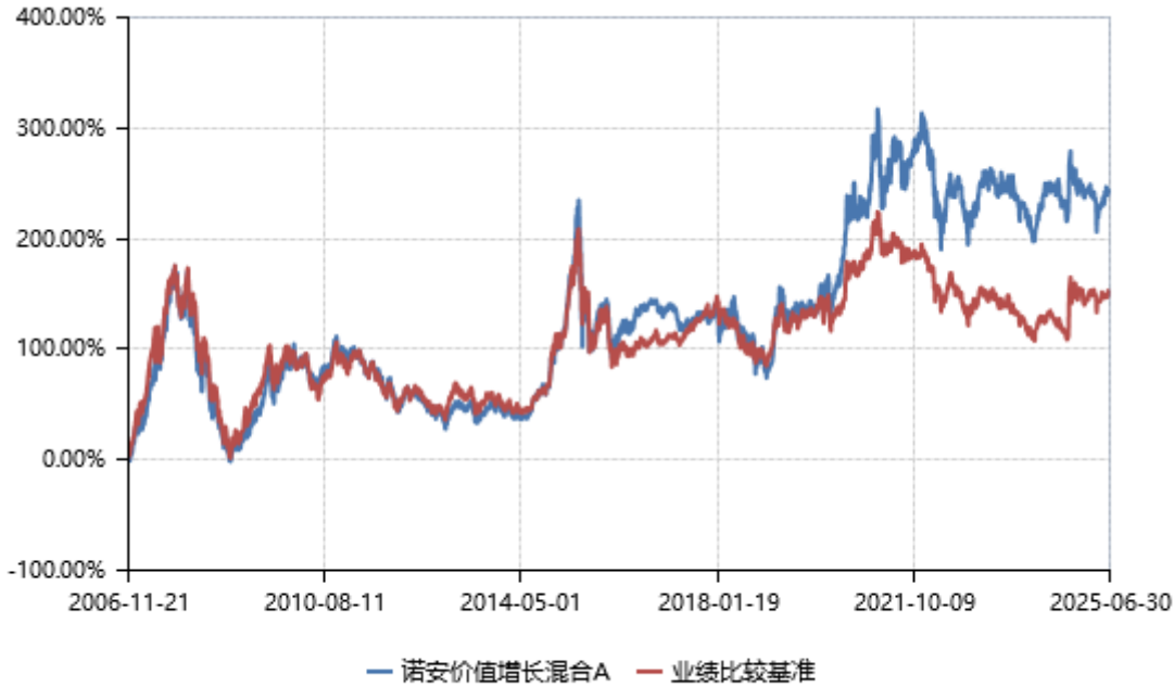
诺安价值增长混合 A