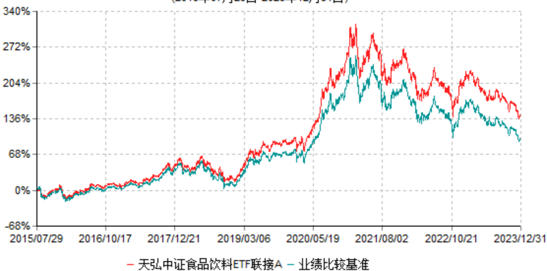
天弘中证食品饮料ETF联接A累计净值增长率与业绩比较基准收益率历史走势对比图 (2015年07月29日-2023年12月31日)