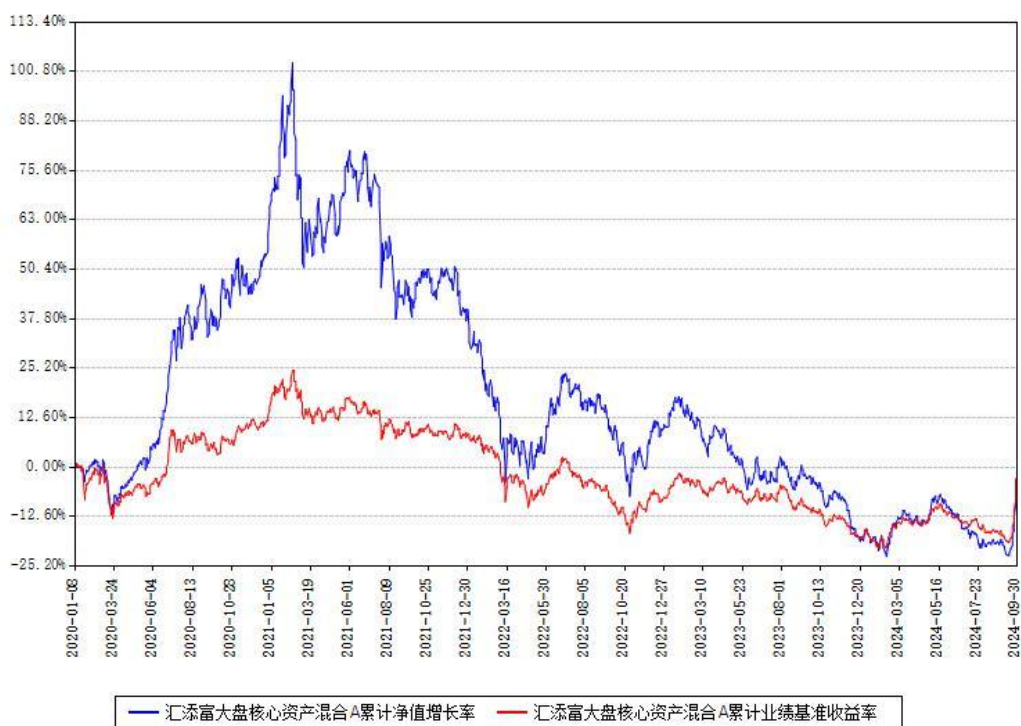
汇添富大盘核心资产混合A累计净值增长率与同期业绩基准收益率对比图

(二)自基金合同生效以来基金累计净值增长率变动及其与同期业绩比较基准收益率变动的比较图