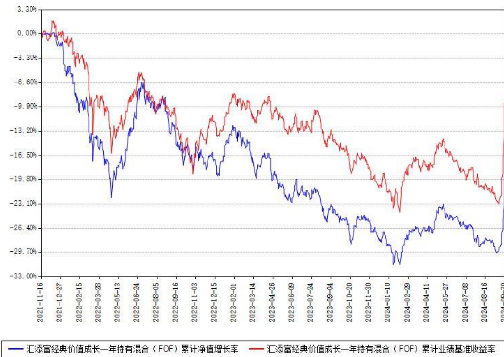
汇添富经典价值成长一年持有混合（FOF）累计净值增长率与同期业绩基准收益率对比图