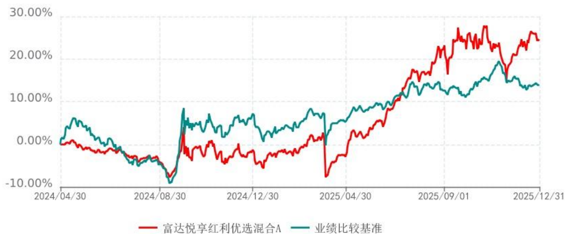
富达悦享红利优选混合C累计净值增长率与业绩比较基准收益率历史走势对比图