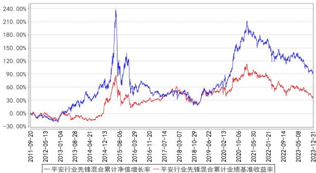
平安行业先锋混合累计净值增长率与同期业绩比较基准收益率的历史走势对比图