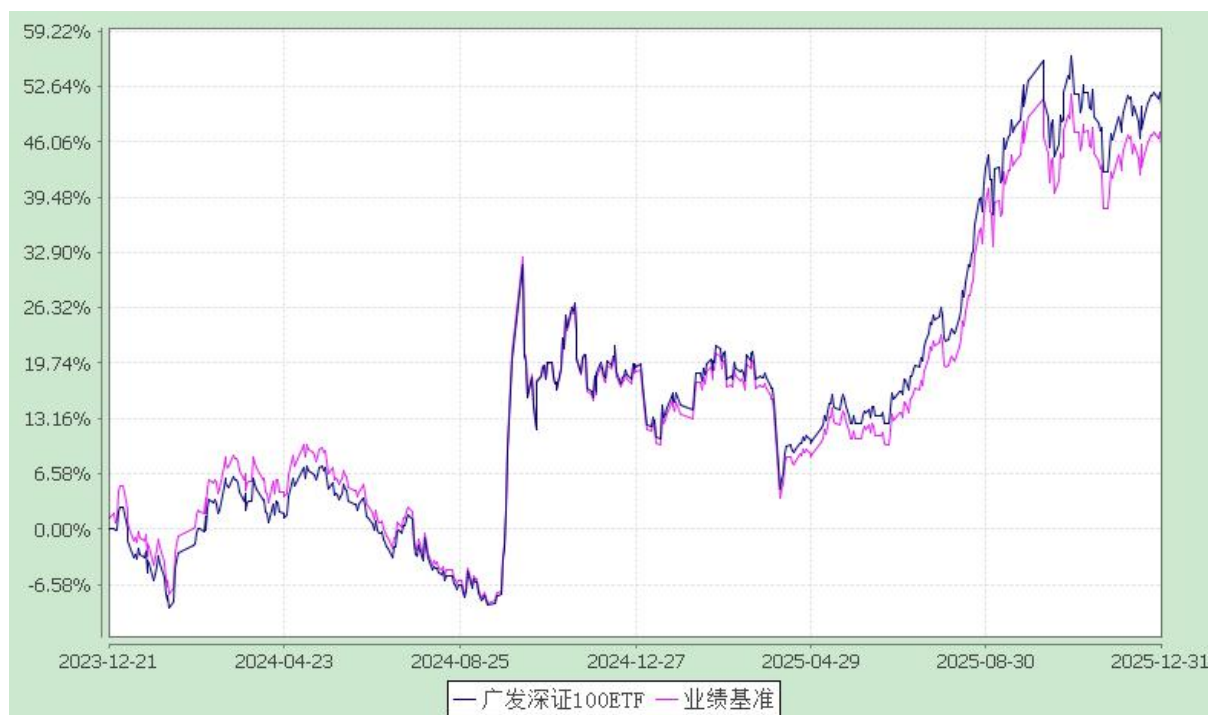
广发深证 100 交易型开放式指数证券投资基金 份额累计净值增长率与业绩比较基准收益率的历史走势对比图 (2023 年 12 月 21 日至 2025 年 12 月 31 日)