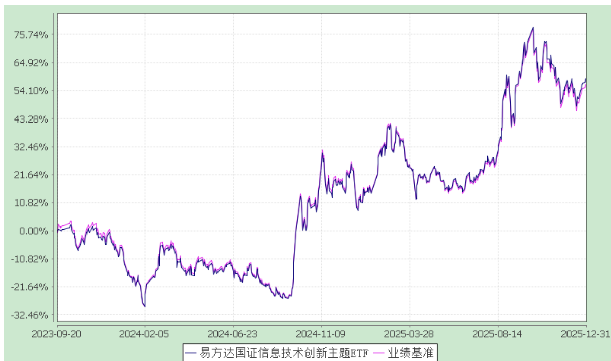
易方达国证信息技术创新主题交易型开放式指数证券投资基金 份额累计净值增长率与业绩比较基准收益率历史走势对比图 (2023 年 9 月 20 日至 2025 年 12 月 31 日)