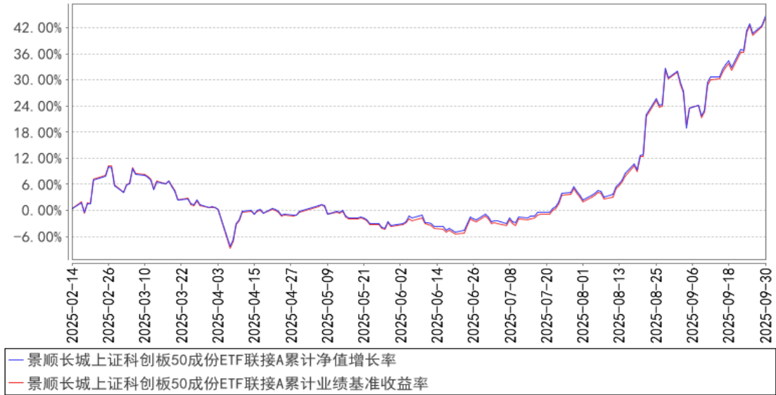
景顺长城上证科创板50成份ETF联接A累计净值增长率与同期业绩比较基准收益率的 历史走势对比图