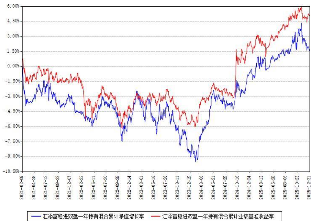
汇添富稳进双盈一年持有混合累计净值增长率与同期业绩基准收益率对比图

注：本基金建仓期为本《基金合同》生效之日（2021年02月09日）起6个月，建仓期结束时各项资产配置比例符合合同约定。