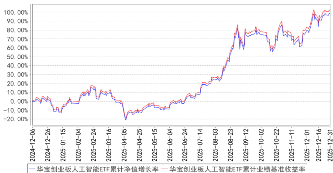
华宝创业板人工智能ETF累计净值增长率与同期业绩比较基准收益率的历史走势对比图

注：按照基金合同的约定，基金管理人应当自基金合同生效之日起 6 个月内使基金的投资组合比例符合基金合同的有关约定，截至 2025 年 06 月 06 日，本基金已达到合同规定的资产配置比例。