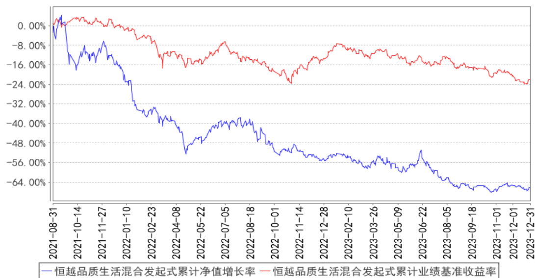
恒越品质生活混合发起式累计净值增长率与同期业绩比较基准收益率的历史走势对比图