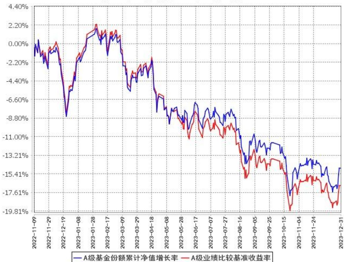
A级基金份额累计净值增长率与同期业绩比较基准收益率的历史走势对比图 (2022年11月9日至2023年12月31日)