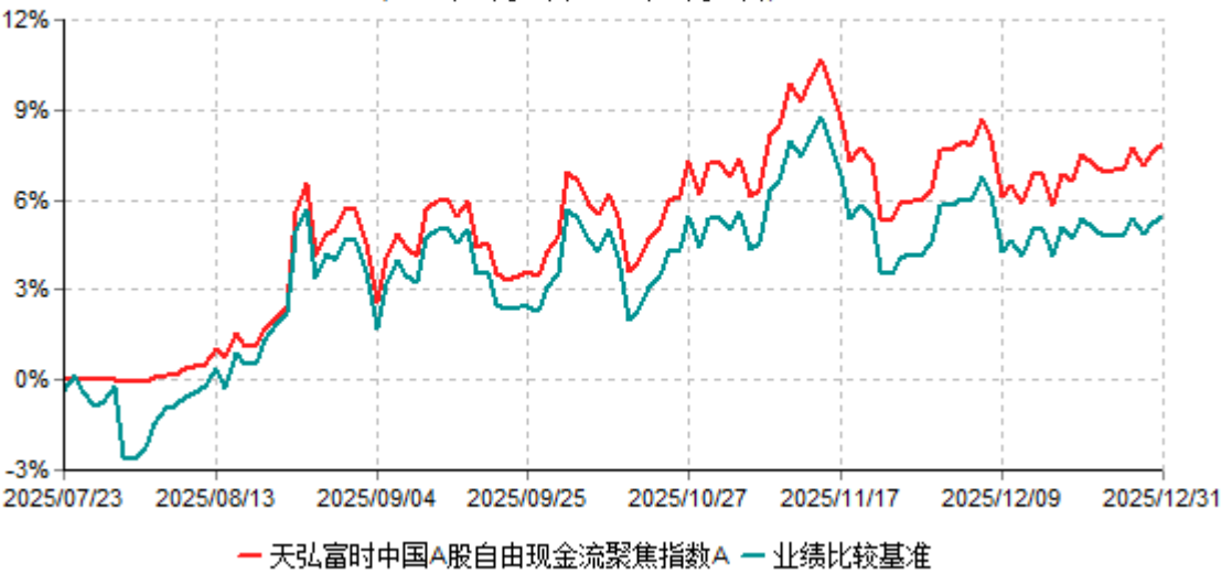
天弘富时中国A股自由现金流聚焦指数A累计净值增长率与业绩比较基准收益率历史走势对比图 (2025年07月23日-2025年12月31日)