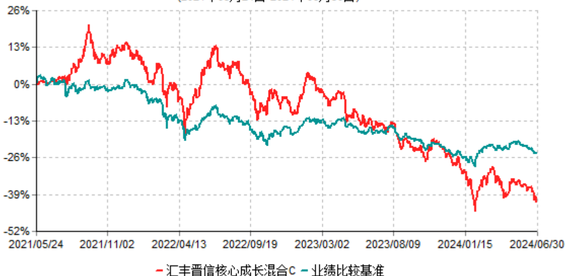
汇丰晋信核心成长混合C累计净值增长率与业绩比较基准收益率历史走势对比图 (2021年05月24日-2024年06月30日)